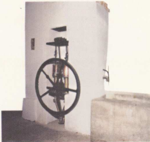
Pompa per abbeveratoio

Affiancano l'attività del Museo particolari iniziative che vengono svolte durante l'anno, quali la dimostrazione di trebbiatura del mais e la pigiatura tradizionale dell'uva.