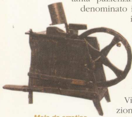
Mola da arrotino

Le esposizioni costituiscono un utile strumento per la didattica della scuola, a disposizione degli insegnanti e degli studenti.