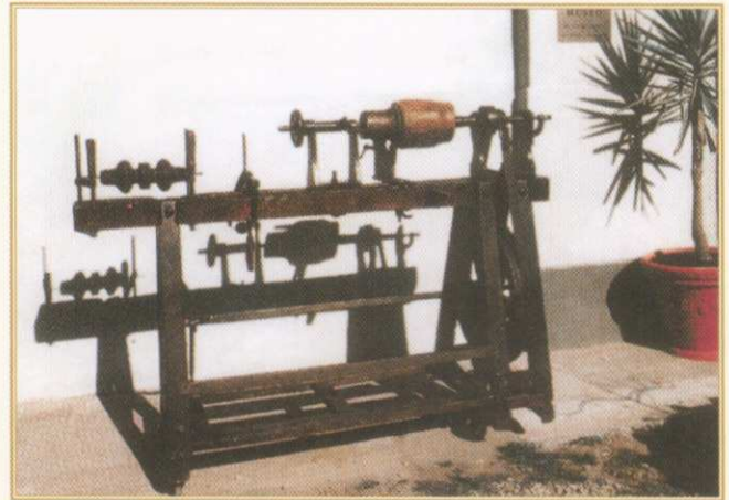
Tornio da legno